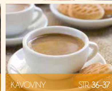
KÁVOVINY STR. 36-37