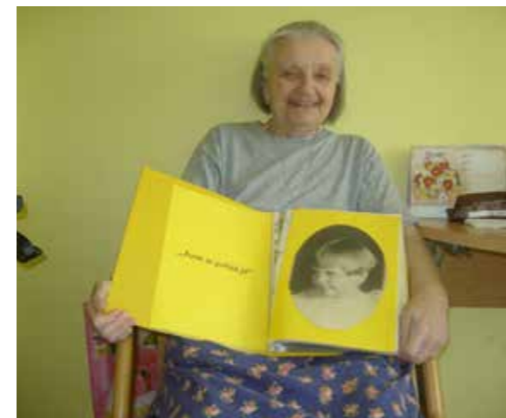
Lidský život je plný vzpomínek. A právě ty zaznamenávají do osobních Knih života.