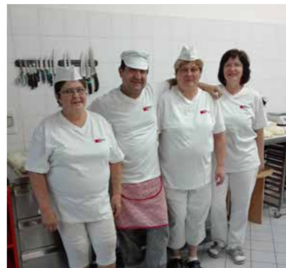
Kolektiv kuchyně - lidsky i profesně skvělý tým.

Obyvatelům našeho domova poskytujeme stravu 5x denně. Snídani, přesnídávku, oběd, svačinu a večeři, diabetici dostávají ještě II. večeři. Celkem denně připravujeme kolem 140 obědů. Z toho je asi 50 obědů pro naše klienty, 75 obědů pro cizí strážníky a zbytek zaměstnaneckých. Klienti mají na výběr ze dvou variant obědů i večeří, o víkendech podáváme studené večeře. Poskytujeme čtyři základní diety - racionální, diabetickou, žlučnickovou a diabetickou žlučnickovou. Velký zřetel klademe na individuální potřeby jedince a není pro nás problém stravu upravit vždy dle potřeb klienta, jeho aktuálního zdravotního stavu, kousacích potíží, výběru potravin... Zakládáme si na výběru kvalitních surovin, vyhýbáme se polotovarům a maximum pokrmů připravujeme