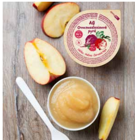
Petra z našich posledních novinek zaujalo nejvíce ovocno-zeleninové pyré a kaštanové chlebičky.

Když se vrátím do svých školních let a vzpomenu si na naši školní jídelnu a na jejich tehdejší výtvořky a porovnám je s tím, jak to vypadá ve školních jídelnách dnes, je to nebetyčný rozdíl. V pestrosti jídel, jejich přípravě, chuti, možnosti výběru. Myslím si, že především v poslední době udělalo školní stravování značný pokrok správným směrem. A upřímně řečeno, smekám před všemi těmi mizerně placenými kuchařkami, které se i přes své značné neohodnocení (jak finanční, tak lidské) mnohdy stále snaží vykouzlit pro naše děti dobrá jídla.