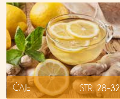
ČAJE STR. 28-32