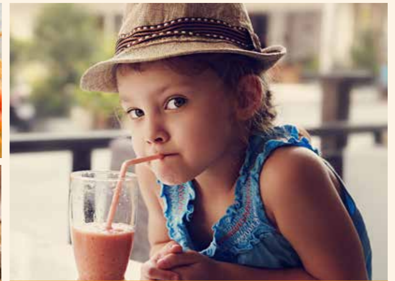
MILKY SHAKE STR. 38-39