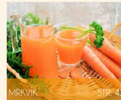
MRKVÍK STR. 41