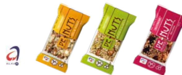
Kešu a mandle

■ bez konzervantů ■ bez průmyslově ztužených tuků ■ vhodné pro celiaky