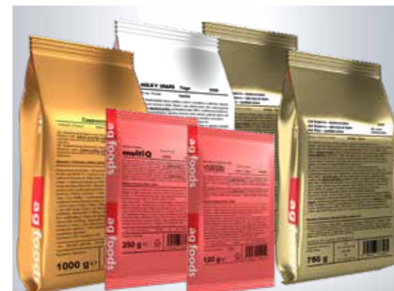
Vitamínový premix obsahují i některé naše výrobky.