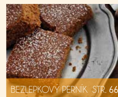
BEZLEPKOVÝ PERNÍK STR. 66