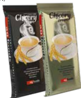
Chicory Dream Mild