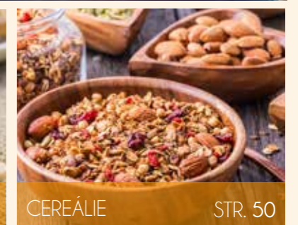
CEREÁLIE STR. 50