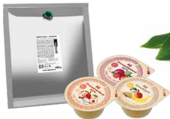
Jablko 120 g