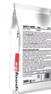
Milky Shake Yogo Vanilka