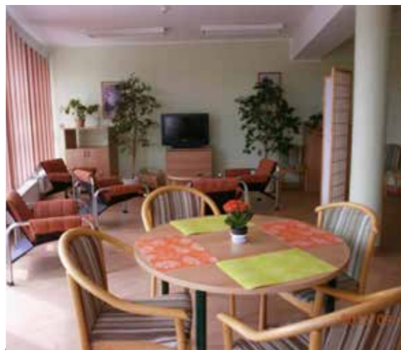
Příjemné společenské prostory - čas pro setkávání.