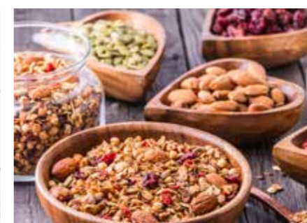
CEREÁLIE STR. 49