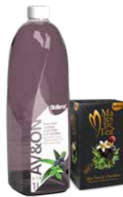
VÍCE NA STR. 70

Rostlina je pro své blahodárné účinky známá již tisíce let. Hlavními produkty s odlišným působením jsou latex s projímavým účinkem a gel, který je naopak využíván i zevně na spáleniny, odřeniny, či jiná drobná poranění. Průhledný polotekutý gel Aloe vera se nachází uvnitř dužnatých listů. Jedná se o bezbarvou rosolovitou substanci hořké chuti a bez vůně. Za hlavní účinnou látkou aloe se považují polysacharidy, které účinkem enzymů rychle podléhají degradaci. Z toho důvodu pro kvalitu