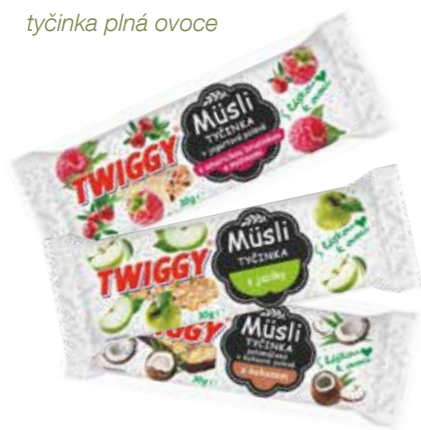
tyčinka plná ovoce