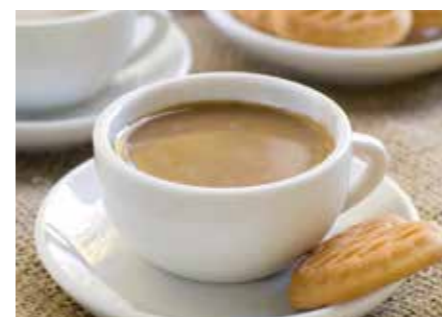
KÁVOVINY STR. 38-39