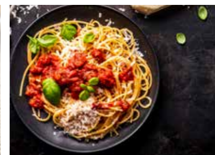
TĚSTOVINY A PŘÍLOHY STR. 64