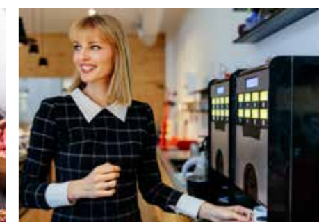
TECHNOLOGIE STR. 68-69