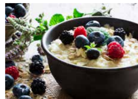
KAŠE STR. 50