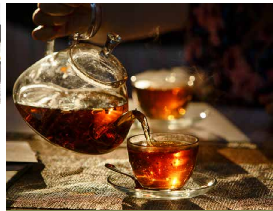
ČAJE STR. 30-35