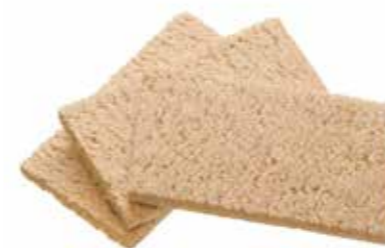
s nízkým obsahem tuku