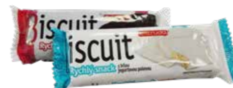
ideální na cesty