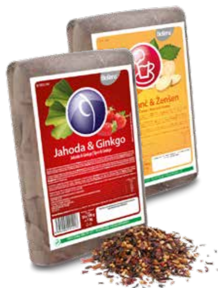
unikátní čajové směsi