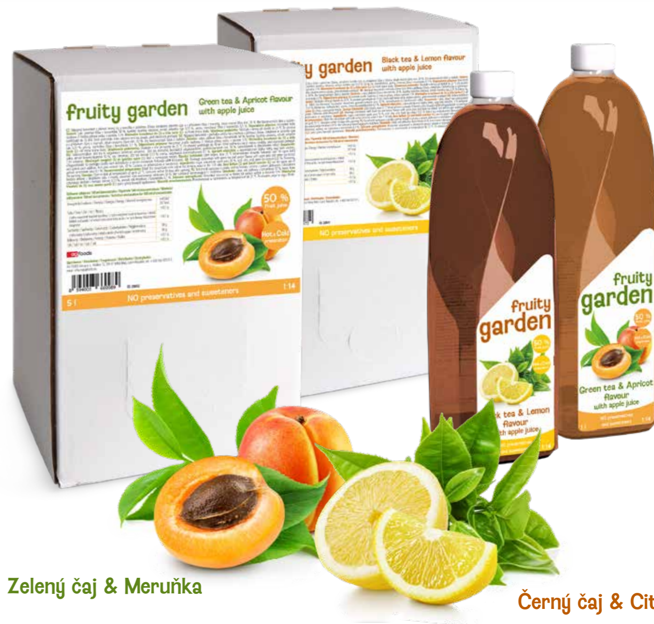
Zelený čaj & Meruňka