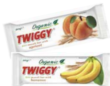
BIO tyčinky pocházejí z ekologické produkce