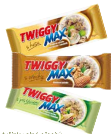
tyčinky plné ořechů