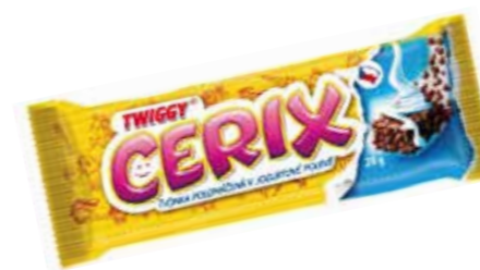
oblíbené u dětí