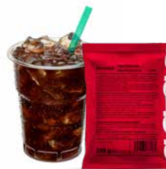
lahodná osvěžující chuť