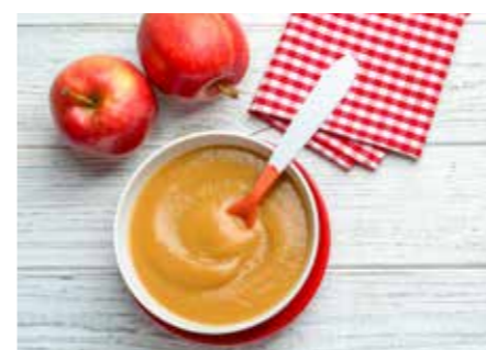
OVOCNÉ PYRÉ STR. 59-60