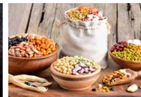
LUŠTĚNINY STR. 66