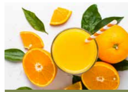
DŽUSY STR. 36