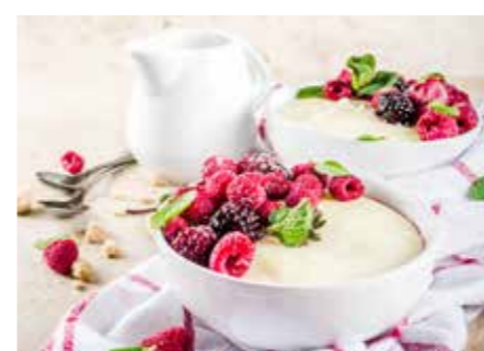
KAŠE STR. 58-59