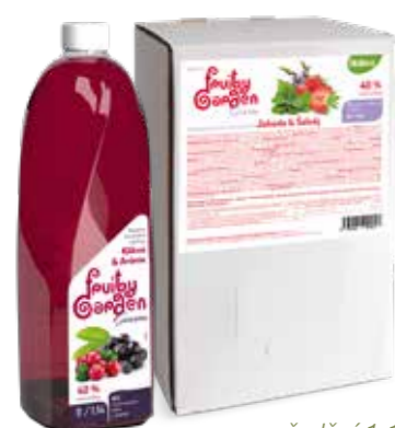
ředění 1:14 za tepla i za studena