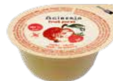
AG OVOCNÉ PYRÉ JABLKO S JAHODOU JE U NAŠICH STRÁVNÍKŮ VELMI OBLÍBENÉ. VÍCE NA STR. 50

Pracuji s velice různorodou skupinou klientů. Skladba stravy tvoří u všech základ s ohledem na jejich zdraví, zvyklosti, oblíbené skupiny potravin i pokrmů. Nutriční složení pravidelně monitoruji propočty nutričních bilancí. Společně s ošetřujícím personálem se snažíme o identifikaci seniorů, kteří jsou nutričně riziková, malnutriční, s poklesem příjmu stravy a hmotnosti. Klientům se zhoršeným nutričním stavem věnuji zvýšenou péči. Kromě stanovení adekvátní potřeby energie a jednotlivých živin, respektive bílkovin, navrhuji vhodnou intervenci (změna diety, volba bílkovinného přídatku) pro naplnění nutriční potřeby. Spolupracuji s lékařkou-nutricionistkou, které připravuji podklady pro preskripci sippingu. Následně navrhuji a monitoruji plán jeho užívání.