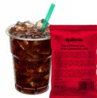
lahodná osvěžující chuť