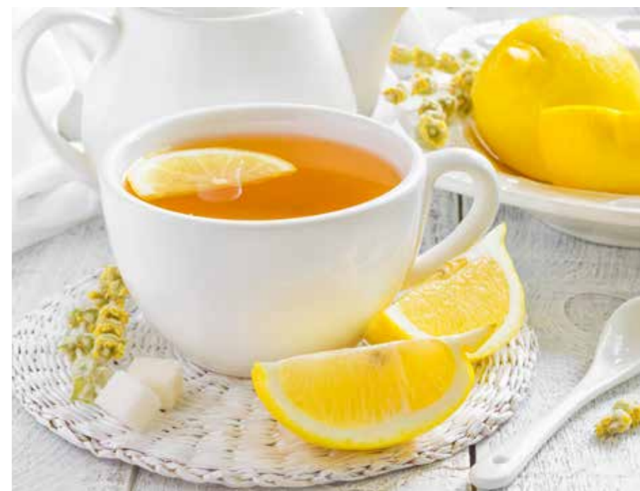
NÁLEVOVÉ ČAJE STR. 33-36