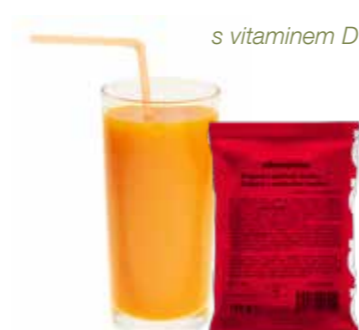
s vitaminem D