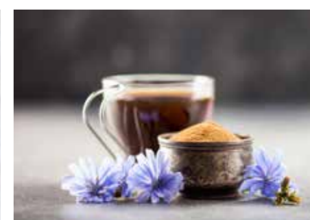
KÁVOVINY STR. 43-44