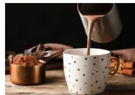
KAKAOVÉ NÁPOJE STR. 42-43