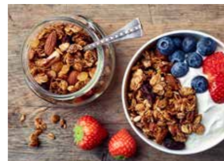
CEREÁLIE STR. 52