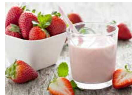
PŘÍCHUTĚ DO MLÉKA STR. 46