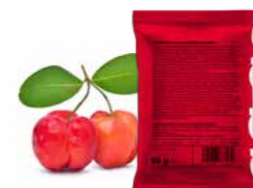
přirodní vitamin C