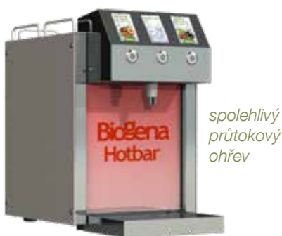
spolehlivý průtokový ohřev