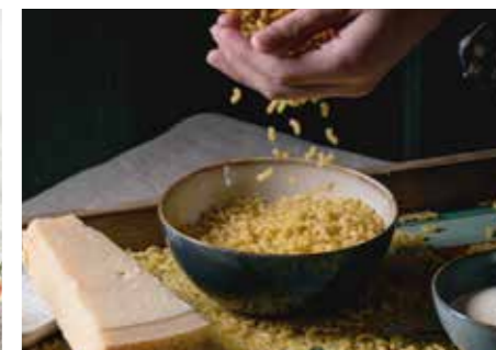
TĚSTOVINY STR. 68