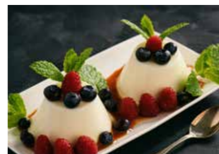
PUDING STR. 63, 65