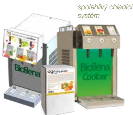
spolehlivý chladicí systém