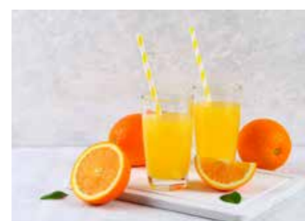
KONCENTRÁTY STR. 38-41